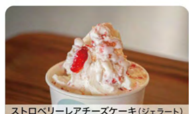
ストロベリーレアチーズケーキ(ジェラート)

M Cafes&Kitchenぎんたろう あんこ好き必見！アツアツのこしあんこにいちごやお団子をディップして楽しむ「いちごのあんこフォンデュ」をぜひご賞味ください！ 湖西市新居町新居1194 TEL 050-8883-4426 ● 11:00-17:00 ● 月曜・第3火曜