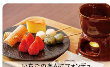
いちごのあんこフォンデュ

L 未来屋 市内の「いちごのイシイ」にほれ込んで、本来の旬のいちごを使ったスイーツが自慢です。カフェコーナーでゆったりとした時間を過ごせます。 湖西市新居町内山2007-16 TEL 053-594-2345 ● 10:00-15:00 ● 火曜・水曜・土曜