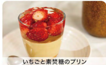
いちごと素焚糖のプリン

A パピヨン新居店 湖西市産の大きないちごを使った「いちごのフレジェ」など大人気のスイーツをどうぞ。 湖西市新居町中之郷1647-1 TEL 053-594-5875 ● 8:00-18:00 ● 火曜・水曜