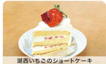
湖西いちごのショートケーキ

A パピヨン新居店 湖西市産の大きないちごを使った「いちごのフレジェ」など大人気のスイーツをどうぞ。 湖西市新居町中之郷1647-1 TEL 053-594-5875 ● 8:00-18:00 ● 火曜・水曜