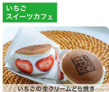
いちごの生クリームどら焼き

B パピヨン湖西店 湖西市産の甘酸っぱいいちごを使った贅沢なショートケーキ。ふわふわのスポンジと生クリームが絶妙に調和する至福の味わいです！ 湖西市岡崎1345-13 TEL 053-577-2508 ● 6:45-18:00 ● 火曜・水曜