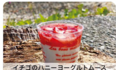
イチゴのハニーヨーグルトムース

E Chiffon 大人気のいちごのシフォンサンドのほか、いちごを使った魅力的なケーキなどがカフェでも楽しめます。 湖西市白須賀3985-2939 TEL 053-522-7567 ● 10:00-19:00 ● 月曜・日曜