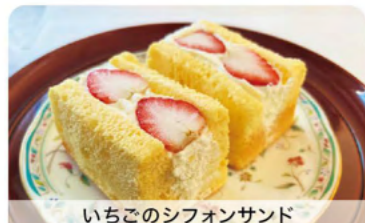
いちごのシフォンサンド

D いちごや 旬のいちごをたっぷり使った魅惑のいちごパフェのほかランチメニューもどうぞ！ 湖西市新居町中之郷32-10 TEL 053-594-2121 ● 11:00-15:00/夜は予約のみ ● 火曜・水曜