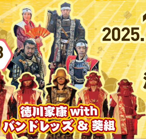
徳川家康 with バンドレッズ & 葵組