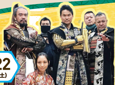
浜松徳川武将隊「葵龍」