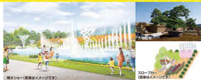
噴水ショー(画像はイメージです)

はままつフラワーパーク 浜松市西区館山寺町195 TEL.053-487-0511