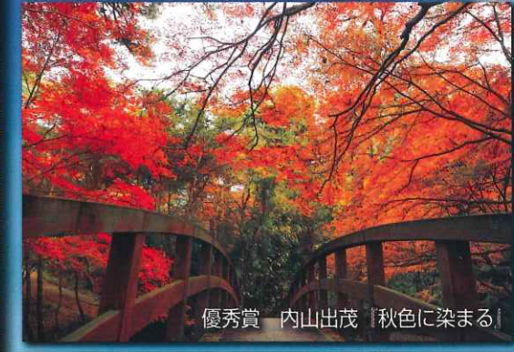
優秀賞 内山出茂「秋色に染まる」