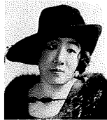
三浦環 (みうら たまき)

本選 ：オーケストラピットを使用し、通常のオペラの上演スタイルで演奏します。選ばれた声の競演をお楽しみください。